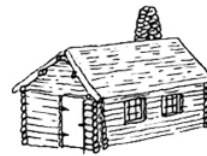
An Taigh-logaichean La maison en bois rond

Les forêts de la Nouvelle-Écosse (1770s-1850s)