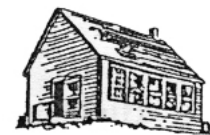
An Taigh-sgoil L'école

La Nouvelle-Écosse gaélique (1880s–1920s)