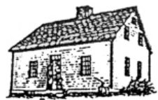
Taigh an t-Simileir La maison avec une cheminée centrale

Nous sommes bien préparés pour vivre une vie stimulante dans la grande forêt acadienne. Nos foyers demeurent des endroits confortables pour se réunir et raconter des histoires, chanter des chansons et parfois faire de la musique ou prier à la fin d'une longue journée de travail.