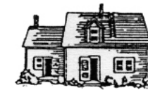
Taigh Tùs na Ficheadamh Lìn La maison du tournant du siècle

La laine et sa préparation avant de la filer sont des éléments très importants de notre vie rurale. Grâce au moulin à carder, nous ne sommes plus obligés de carder de grandes quantités de laine à la main. Beaucoup de Gaëls des régions voisines apportent la laine ici pour la nettoyer et la carder. Pendant des siècles, nous avons utilisés la laine filée pour tisser, sur nos métiers, un grand morceau d'étoffe, le clò mór, pour faire les couvertures et les vêtements.