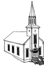
An Eaglais L'église

Bâtir de nouvelles collectivités (1850s–1880s)