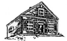
An Taigh-marsantachd Le magasin général

Les enseignants ont comme directives d'enseigner seulement en anglais. Nos enfants sont souvent punis quand ils parlent gaélique à l'école. On nous dit que l'avenir appartiendra à ceux qui parleront anglais. Lors de soirées spéciales et des célébrations, nous déplaçons les pupitres pour danser au son de la musique ou pour chanter à la table de fouflage.