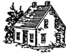
Taigh na Transa La maison au corridor central

Nos collectivités sont jeunes. Il y a peu de membres du clergé chez nous. Quand commence la construction d'églises, nous marchons ou voyageons en carriole, en charrette ou en bateau pour assister à la messe ou au service du dimanche.